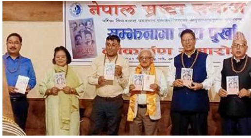
16. Samjhana Mera Purkha' (In Memory of My Ancestors) 2023