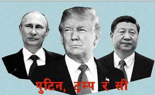
पुटिन, ट्रम्प र सी

अमेरिकी राष्ट्रपति डोनाल्ड ट्रम्पले यद्योत्तर अन्तर्राष्ट्रिय व्यवस्थासाथि गम्भीर आघातका व्यक्त गरेका छन्। उनका पछिल्ला भाषणहरू तथा संयुक्त राष्ट्रसंघमा अमेरिकाले गरेको मतदानमा ट्रम्प पशासन शान्तिपूर्ण रूपमा रहेको आफ्नो छिमेकी युकेन गिबुद्ध आक्रमण गर्ने रूसको पक्षमा उभिएको छ। ट्रम्पले जनताले दिन थालेका भन्सार महसुल बढाउने धम्कीले लामो समयदेखि चल्दै आएका गठबन्धनमा संशय पैदा गराएको छ। वैश्विक व्यापार प्रणालीमा पनि प्रश्न उठेको छ। पेरिस जलवायु सम्मतीता र विश्व स्वास्थ्य संगठनबाट बाहिरिने निर्णयले राष्ट्रहरूका सीमापार हुने विविध खतरा विरुद्धको सहकार्यलाई अग्रोरे बनाएको छ।