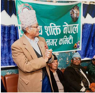
By Uttam Karmacharya