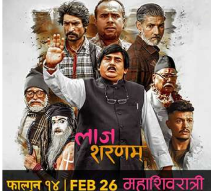
फाल्गुन १४ | FEB 26 महाशिवरात्री

९० दिनका लागि यूएसआइडीका सबै लगानी स्थगित राखेको अमेरिकाले नेपालाई दिने भनेर पूर्वघोषित सहयोग खारेज गरेको छ । अमेरिका जगतले तिरको करको पैसा अमेरिकामै खर्च गरेर अमेरिकालाई सर्वाधिकमान बनाउने नीति छ । चीन र भारतसँग पनि अमेरिका कडीकडाउ खालको नीति अखिर गर्न थालेको छ भने नेपालका लागि सकारात्मक नहुने लक्ष्य छ । नेपालले उत्तरदक्षिण समर्पण र अर्थसँग परिपक्व कूटनीति चालिहाल्न विरलेपकहरूले सुफाव दिएका छन् ।