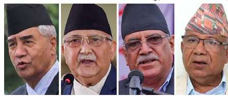
विश्लेषकहरू भन्नु- जनविरोधी यो कसमाथि कारवाही हुनुपर्छ, ०४६ सालपछि अर्थात् खर्चपति राजनीतिबाट कसरी सम्भव छ ? सम्पत्ति शुद्धीकरणको सुई त्यतातिर सोभिनुपर्ने हो ? देउवा, ओली, प्रचण्ड र अन्य नेतामाथि तर्कियो भने के होला ?