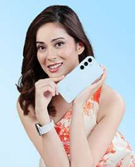
Image credit: Samsung. All rights reserved. Samsung is a trademark of Samsung Electronics Co., Ltd.