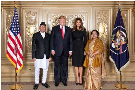
K P Sharma Oli Congratulations to H.E. Mr. Donald J. Trump on assuming office as the 47th President of the USA. Best wishes for a successful tenure. Nepal and the US share 75+ years of warm ties, and I look forward to working together to further strengthen our partnership. @realDonaldTrump

प्रधानमन्त्री केपी ओलीले अमेरिकी राष्ट्रपति डोनाल्ड ट्रम्पलाई बधाई दिँदै मिलेर काम गर्न उत्सुक छु भन्ने सन्देश दिएका छन्। प्रधानमन्त्रीले समाजिक सञ्जाल एक्समाफत अमेरिकी राष्ट्रपति ट्रम्पलाई बधाई दिएका हुन्। प्रम ओलीले सन्देशमा लेखेका छन्- 'संयुक्त राज्य अमेरिकाको ४७औँ राष्ट्रपतिको रूपमा कार्यभार सम्हाल्नु भएकोमा डोनाल्ड जे. ट्रम्पलाई हार्दिक बधाई तथा शुभकामना छ। नेपाल र अमेरिकाबीच ७५ भन्दा बढी वर्षदेखि आत्मीय सम्बन्ध रहँदै आएको छ, र म यो साझेदारीलाई अझ बलियो बनाउन सँगै काम गर्न उत्सुक छु।' तर अमेरिकी कानूनविपरित अमेरिकामा रहेका सबैलाई फकाउ गर्दै फिर्ता पठाउन थालेपछि राष्ट्रपति ट्रम्पको कार्यकालको सुरुआत विश्वभरि नै चर्चाको विषय बनेको छ। समाचारअनुसार अनियमित रूपमा अमेरिका पसेका र वसेका नेपालीहरूको संख्या ३ हजार रहेको र तिनीहरू फिर्ता पठाउने विषयमा नेपाललेके गर्ला ? नेपालको परराष्ट्रमन्त्रालय र प्रधानमन्त्रीले सुख खोलेका छैनन्।