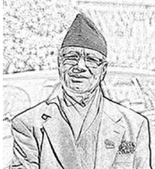
By Uttam Karmacharya