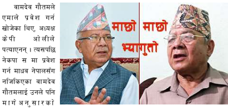
माछो माछो भ्यागुतो