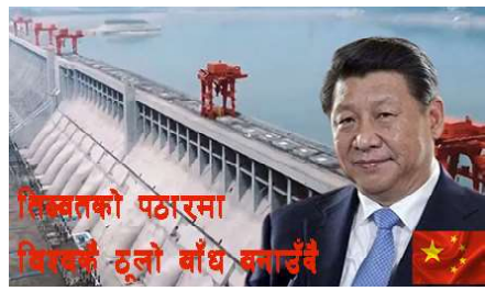
सिक्किमको पठारमा भिचरको ठूलो बाँध बनाउँदै

चीनले तिब्बतका यालुङ स्याङ्पो नदीमा बनाउन थालेको जलविद्युत आयोजनाको विषयमा भारतमा मात्र होइन नेपालमा पनि विरोधका स्वरहरू सुन्न थालिएका छ । भारतमा ब्रम्हपुत्र र बंगलादेशमा जमुनाका नामले चिनिने यालुङ स्याङ्पो नदी नेपालको बेसिनमा पर्दैन । नेपाल गण्डक बेसिन पनि साएन नेपालमा रहेर अमेरिकाको पश्चिम काम गर्नेहरू यो आयोजनाको विरोधमा देखिएका छन् । अर्कोतर्फ भारतको पश्चिम काम गर्नेहरूको चासो भने भारतीय चिन्तासँग जोडिएको छ । चीनले सुरू गरेको यो जलविद्युत आयोजना तिब्बतको पश्चिम ठूलो हो । यो विश्वचर्चित बनेको छ । चीनसँग तल्लो तटीय क्षेत्रको हितमा माथिल्लो तटीय क्षेत्रले ख्याल गर्नु पनि भारतको चिन्ता र चासो रहेको देखिन्छ । आयोजनाले बनाउने बाँधका कारण पनि सक्ने प्रभावका विषयमा भारतको चिन्ता रहेको भन्ने देखाउने विषय हो । यो भन्दा भित्र पसेर हेर्दा भारतमा पानीको