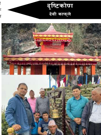
दृष्टिकोण देवी काफ्ले

हालै यस पवित्र मन्दिरको प्रचारप्रसार तथा मन्दिरको सौन्दर्यता तथा धार्मिक धरोहरका रूपमा कारिमले परिवारले एउटा आश्रम थपेको छ । २०८१ अर्सा १७ गते घटस्थापना दिनामा कारिमले (जायश्वर) बंशजहरूको २० औं भेलाको निर्णय अनुसार २००००० (अक्षरूप दुईलाख) को लागतमा मुख्यथलो आरूचौर र सो स्थानबाट वसाई सरि चितवन, पोखरा, गैडाकोट, बुटवल र धनगढी लगायतका स्थानमा रहेका सबै बंशजहरू भेला भई पुर्व थलो काँकनीटा र आरूचौरको विच रहेको बालाशिद आश्रम मोझदारी उहरे देउरालीको मन्दिरमा घण्टी राख्ने काम सम्पन्न भयो । उक्त अवसरमा कारिमले बंशजा संयोजक (काँकनीटाबाट पाँच पुस्ता अगाडी आरूचौर वसाई सरि एकाएकै उनीहरूका सन्तानलाई